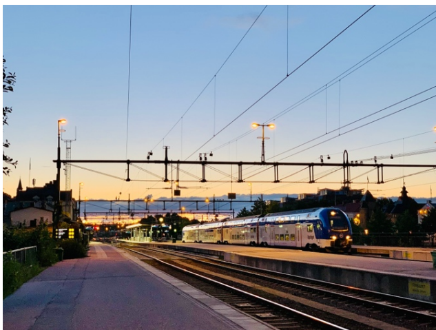
Tåg vid plattformar/stationsområde.

På linjen mellan stationerna inträffade 278 suicid (ca 40 per år). Andelen suicid som skedde på linjen var ca 74% högre än för olyckor, vilket kombinerat med det höga antalet dödsfall, ger extra stöd för att prioritera suicidpreventiva insatser på linjen mellan stationerna. Platser på linjen där suicid inträffat var till ca 40% belägna inom en tätort, och i de flesta övriga 60% av fallen inom gångavstånd från en tätort (median ca 0.5 km, 75% under 1.3 km, 95% under 4.1 km). Likväl var dessa platser vanligen inom en mil från en station (median 1.7 km, 75% under 3.5 km, 95% under 7.4 km), samt ännu närmare en plankorsning (median 1.0 km, 75% under 2.2 km, 95% under 6.5 km). Endast 1.8% av suicid på linjen inträffade vid (<100 m från) eller i en tunnel. Däremot inträffade 95% av alla suicid inom 190 meter av en väg (median 29 meter), vilket var signifikant kortare avstånd än för olyckor (median 54 m). Tågen som åkte på linjen hade också en hög hastighetsgräns (median 140 km/h, nedre/övre kvartil 110/160). På länsnivå står följande 10 län för 80% av alla suicid på linjen: Västra Götalands (43), Stockholms (41), Skåne (39), Östergötlands (20), Uppsala (15), Västmanlands (15), Hallands (14), Jönköpings (12), Södermanlands (12) samt Örebro (10) län